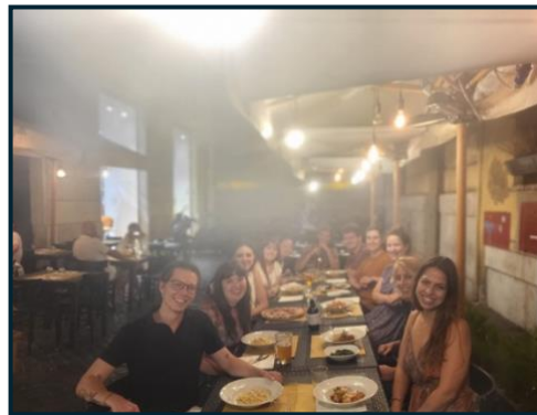
Mais on a l'autre bout !