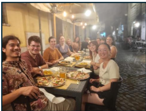
Oui, c'est un peu flou...

Enfin, pour terminer cette avant dernière journée, nous nous sommes toutes et tous retrouvés pour manger ensemble au restaurant le soir ! Pâtes et pizzas, quoi de mieux pour finir un voyage en Italie ?