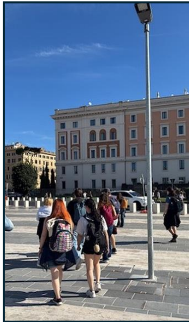
Direction la boulangerie !