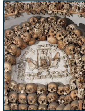
Ça fait beaucoup de crânes...

Enfin, pour terminer cette avant dernière journée, nous nous sommes toutes et tous retrouvés pour manger ensemble au restaurant le soir ! Pâtes et pizzas, quoi de mieux pour finir un voyage en Italie ?