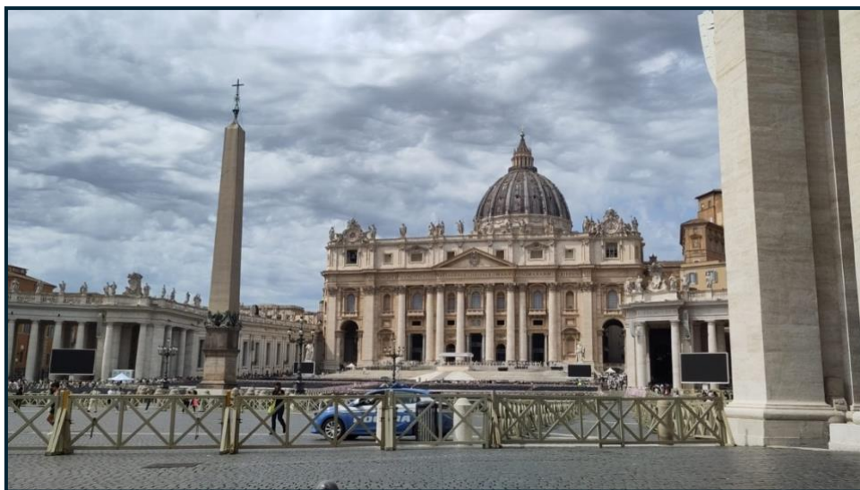
La place St-Pierre