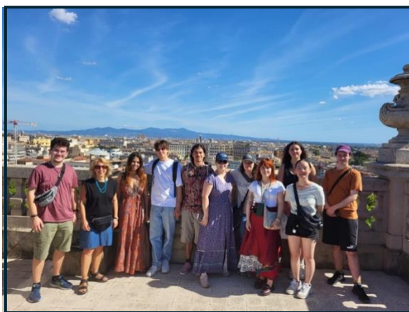
La vue sur Rome

Puis, nous avons traversé le parc de la Villa Borghese pour atterrir dans le quartier dans lequel se trouve l'Institut Suisse. Rome a cela de particulier qu'il existe des instituts de plusieurs pays (France, Belgique...) où culture, science et arts sont promus. Après un repas bien mérité, nous nous sommes rendus à l'Institut Suisse à 15h, en haut de sa propre petite colline. La maison, que dis-je, le manoir ..., a appartenu à une riche famille suisse qui a fait fortune dans la betterave ( oui, oui ...) avant de le céder à la Suisse qui en a fait son Institut. Entouré d'un jardin riche et calme, nous avons un superbe point de vue sur la ville en hauteur.