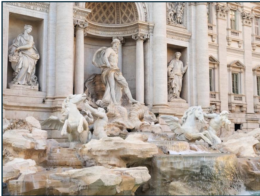
La Fontaine de Trévi