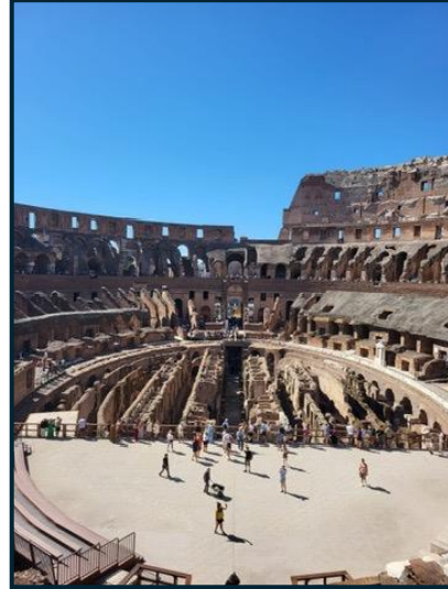
Ma che bello !